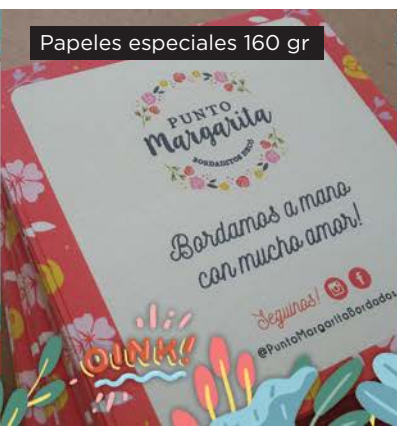
Papeles especiales 160 gr