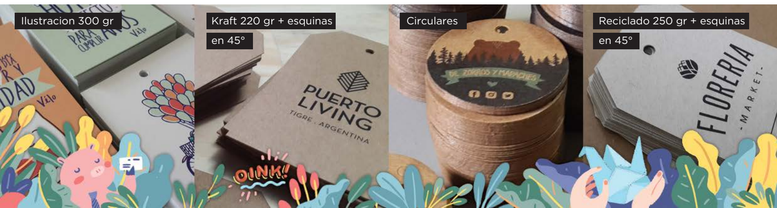
Reciclado 250 gr + esquinas en 45°