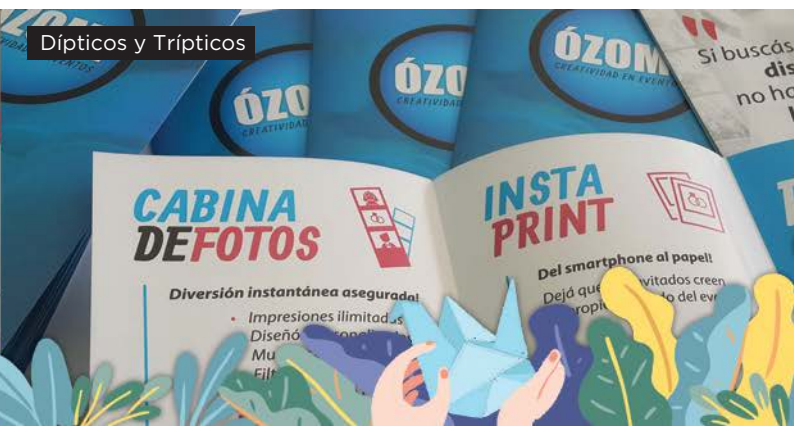
Dípticos y Trípticos