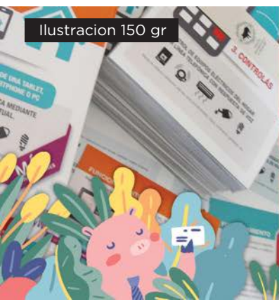
Ilustración 150 gr