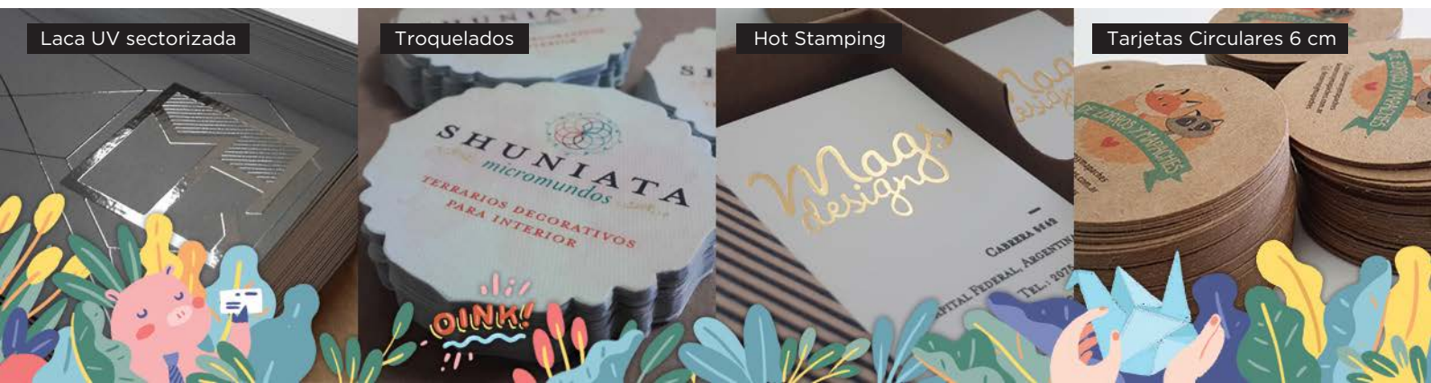
Tarjetas Circulares 6 cm