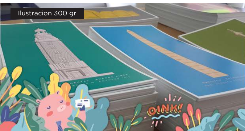
Ilustracion 300 gr